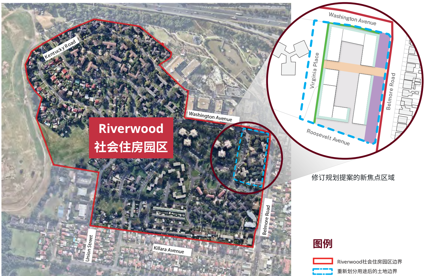
Riverwood社会住房园区俯视图

我们倾听了社区的意见，并将原来新建3900套住房的规划减少至420套新住房。这将保证来自州政府和地方政府的拨款能够充分支持本地基础设施。