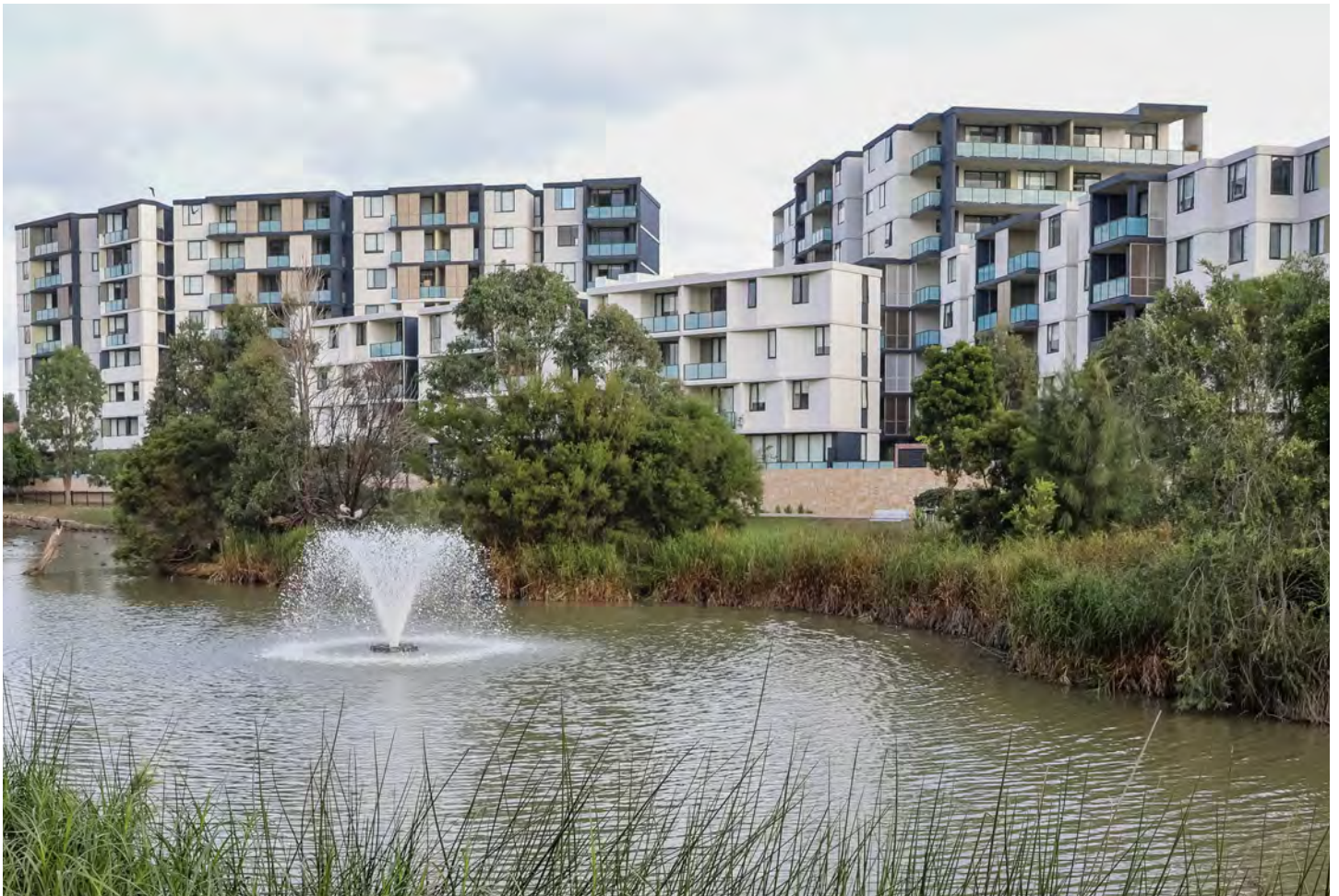
照片: Washington Park, Riverwood

针对全新焦点区域土地用途的重新划分以2017年完成改造的华盛顿公园 (Washington Park) 园区为基础。这项工程以现代和整合化的“混合所有权模式”社区取代了大部分年久陈旧的社会住房。